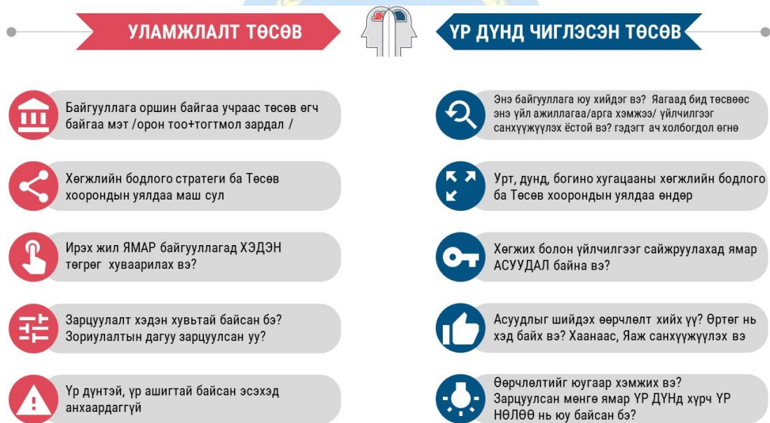
Зураг 3. Уламжлалт төсөв ба Үр дүнд чиглэсэн төсвийн ялгаа